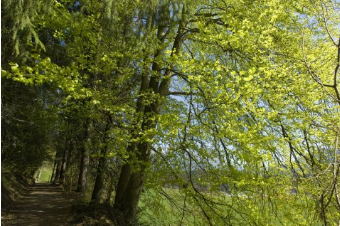
Durch Wald und Wiesen